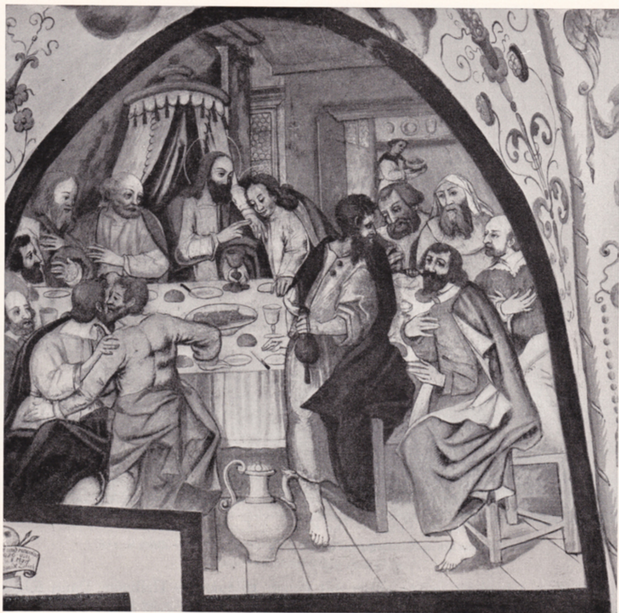
Abb. 184. Furth. — Kapelle S. Carlo Borromeo. Wandbild im Chor von H. J. Greutter 1616. — Text S. 155.