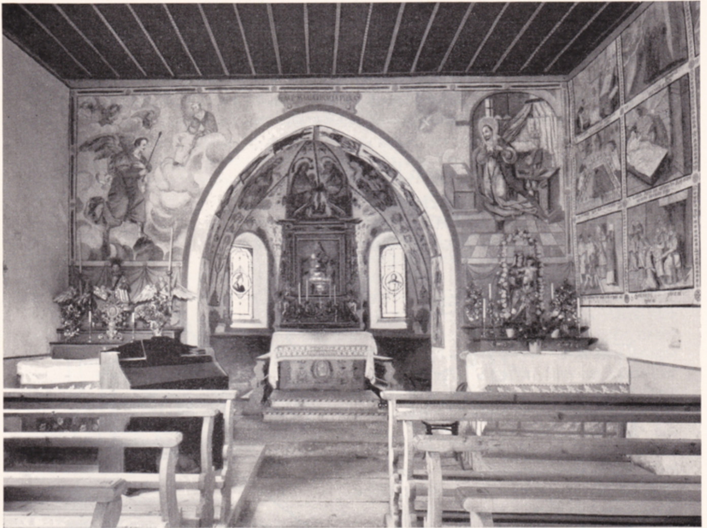
Abb. 182. Furth. — Die Kapelle S. Carlo Borromeo. Innenansicht mit Blick zum Chor.

wand das Datum 1616. Die architektonischen Linien des Gewölbes sind von Laubgewinden betont, und aus den Zwickeln wachsen in gotisierender Art Blumen- und Blattranken. In den Feldern die Gestalten der Evangelisten und der vier abendländischen Kirchenväter, auf Wolkenballen sitzend, sowie zwei posaunenblasende Engel. Die Namen stehen auf geschwungenen Schriftbändern. In der Leibung des Chorbogens zwölf Halbfiguren von Vorfahren Christi (nach Matth. I, V. 6–11), deren Namen auf Schriftbändern stehen 1 : DAVID, ASA, JOSAPHAT, JORAM, EZECHIAS (statt USIA), AHAZ (AHAS), JOSIAS (statt Hiskia), MANASSE, JOZIAS (Josia), JOATAM, SALOMON, JESSE (Abb. 183). Im Scheitel des Bogens steht die Signatur des Malers: „M(aler) Hans Jakob Greutter von Bryren“ (Abb. Bd. I, S. 159).