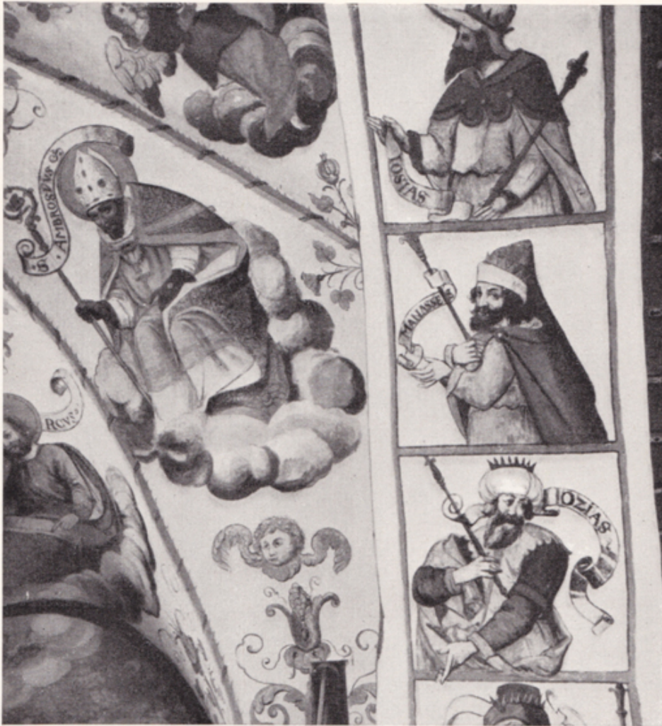
Abb. 183. Furth. — Die Kapelle S. Carlo Borromeo.

Wandmalereien im Chorbogen, von H. J. Greutter, 1616. — Text S. 156.