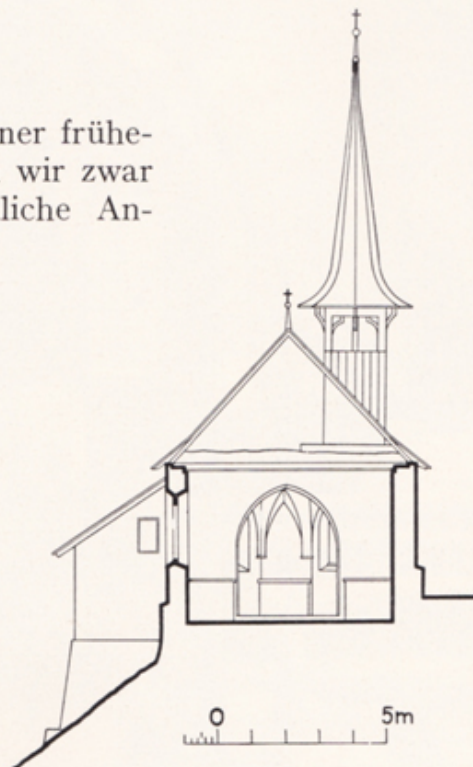
Abb. 181. Querschnitt. — Maßstab 1:300.