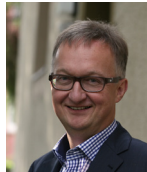
Stadtdekan Søren Schwesig